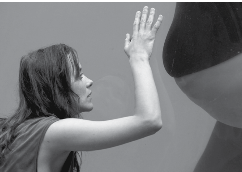
De rouille et d'os